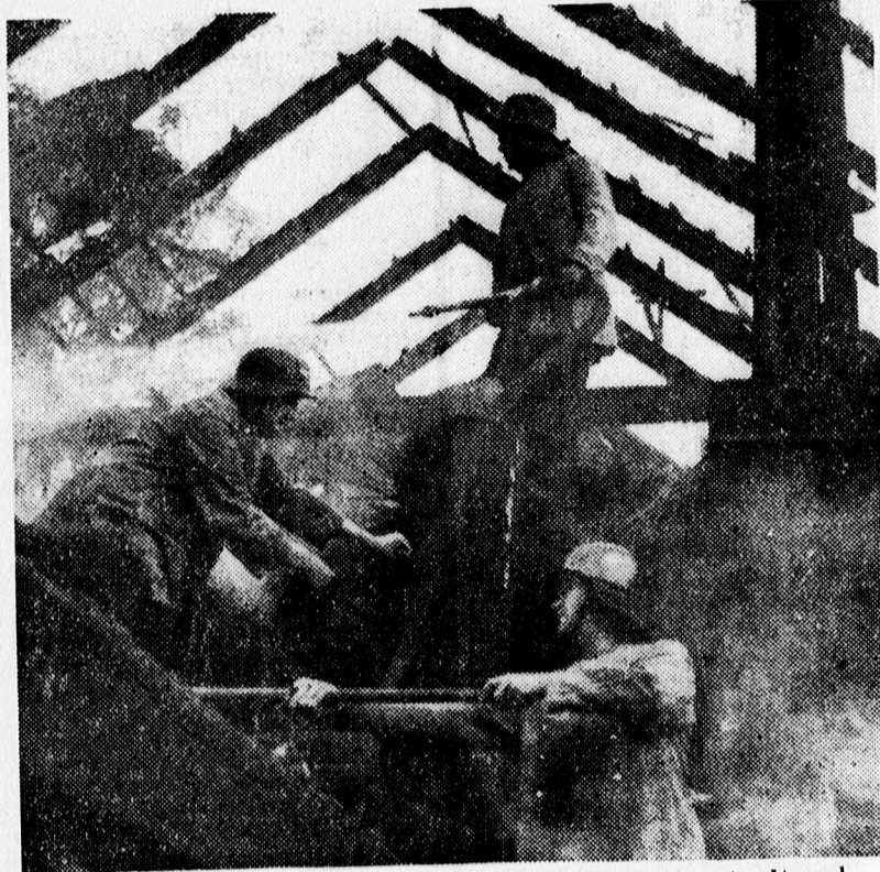
Berlin külvárosában egy bomba által okozott tetőtűzet oltanak.