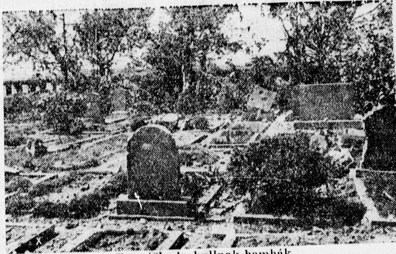
Temetőbe is hullnak bombák...