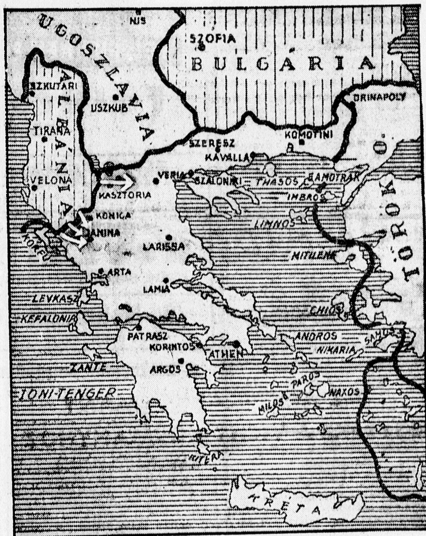
Az olasz előnyomulás irányait a nyilak jelzik.

Olasz mértékadó helyen a legnatározottabban cáfolják, hogy az olasz viszály bárminő tárgyalásokkal volna elintézhető. Hangsúlyozzák, hogy amikor Görögország visszautasította az olasz ultimátumot, ezzel megindította az olasz hadigépezetet, amely csak akkor fog megállni, amikor elvégezte a rábizott feladatokat. A szombati hivatalos hadijelentés utal arra,