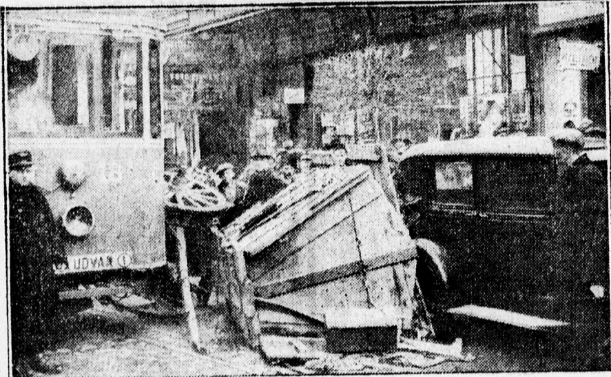
A karambol következtében felborult a 30 mázsás teherkocsi és megrongálta a mellette levő autót.

nak nem történt semmi baja. A reggeli órákban nagyforgalmú Piac uca pillanatok alatt hatalmas tömeg gyűlt össze, értesítették a karambolról a rendőrséget, ahonnan Szücs Jenő detektív szállt ki a helyszíni szemle megejtésére. A karambol következtében ember nem sérült meg, azonban úgy a teherkocsi, mint a villamos súlyosan megrongálódott, sőt a felborult teherkocsi oldalával egy autónak is nekivágódott és azt is megrongálta. A karambol közel félórás forgalmi akadályt okozott a fővonalon.