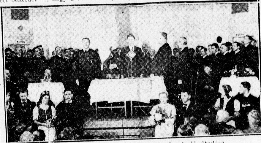
Az ipartestület jubileumi ünnepélyéről. A zászló átadása.

testület és a benne élő kézművesiparosság közérdekű munkáját a Mindenható áldásától kísérve, boldog hazában véghezgezhesse.