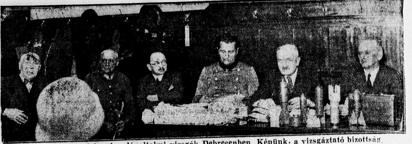
Javában folynak a légoltalmi vizsgák Debrecenben. Képünk: a vizsgáztató bizottság.

KARÁCSONY VAMOSI PAPIRÜZLETÉBEN SZÍNHÁZTÁJÁRÓ