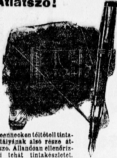
A Sonneneken töltőtoll tintatartályának alsó része átlátszó. Alládoan ellenőrizheti tehát tintakészletét.