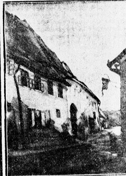
„SEGESVÁR” Littetcky Endre képkiallítása a Déri-múzeumban.

A kiállítás még négy napig tart és délelőtt 10—1 óráig és délután 4—7-ig megtekinthető. Belépődíj nincs. A katalógus vásárlói között 23-án két képet sorsol ki a művész.