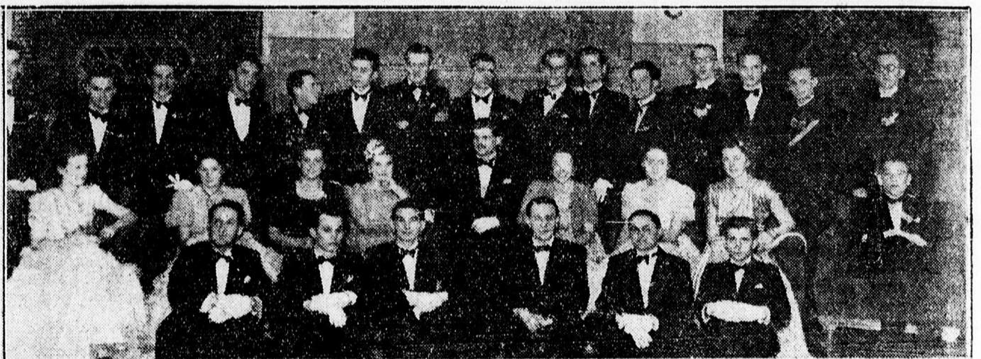
A Jogász-estély rendezősége