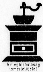
A megbízhatóság ismertetőjele!

Pompás szín, kiváló zamat, étvágygerjesztő illat, tökéletes finom íz: