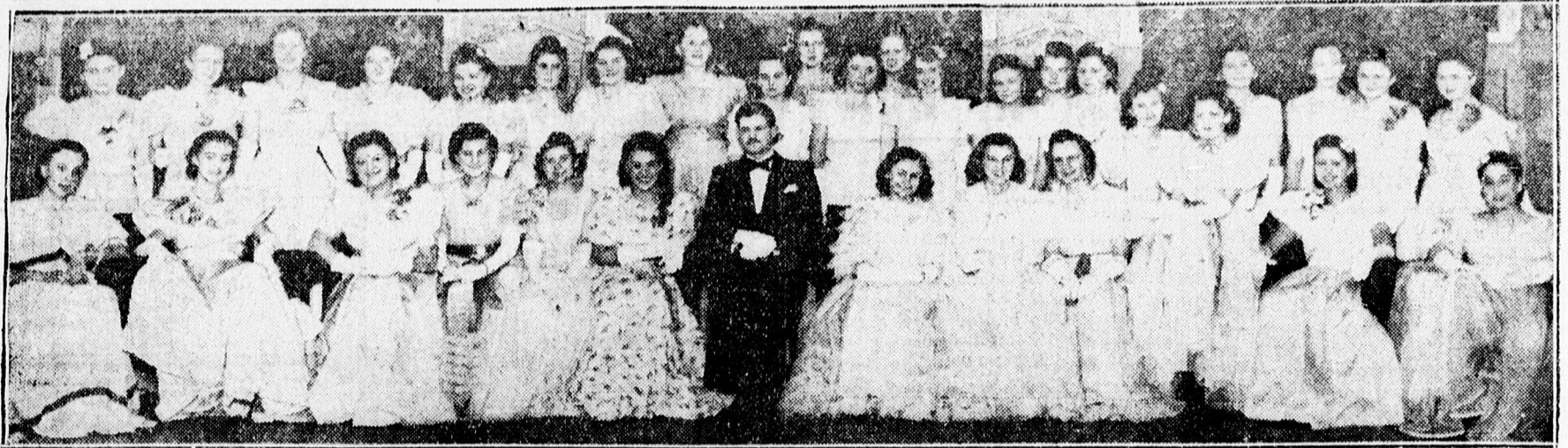
Első bálzó úrlányok a Jogász-estélyen