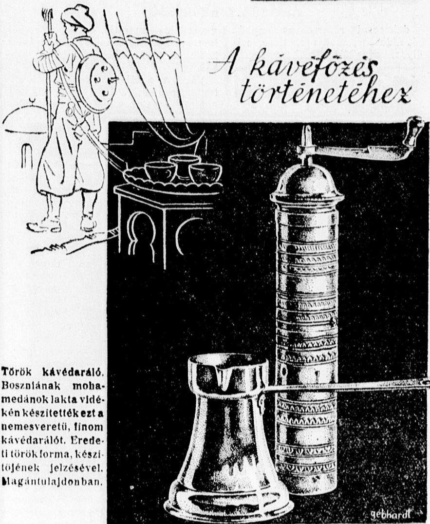
Török kávédaráló. Bosznának mohamedánok lakta vidékén készítették ezt a nemesveretű, finom kávédarálót. Eredeti törökforma, készítőjének jelzésével. Magántulajdonban.