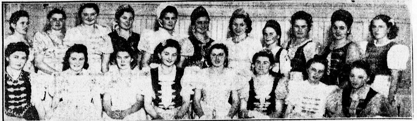
MAGYARRUHÁS LÁNYOK A GAZDABÁLON AZ ARANYBIKA DISZTERMÉBEN.

— Nagy havazások Törökországban. Trapezunt és Erzerum között másfél méteres hó borítja az utakat, az egyes helységek között a közlekedés megszakadt.