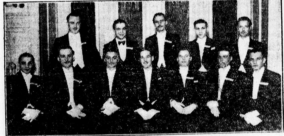
A szépsikerű Gazdász-estély rendezősége.