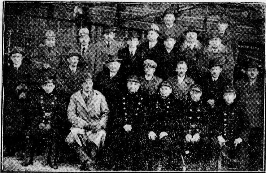
LÉGOLTALMI OKTATÓ TANFOLYAM HALLGATÓI ÉS AZ OKTATÓK.