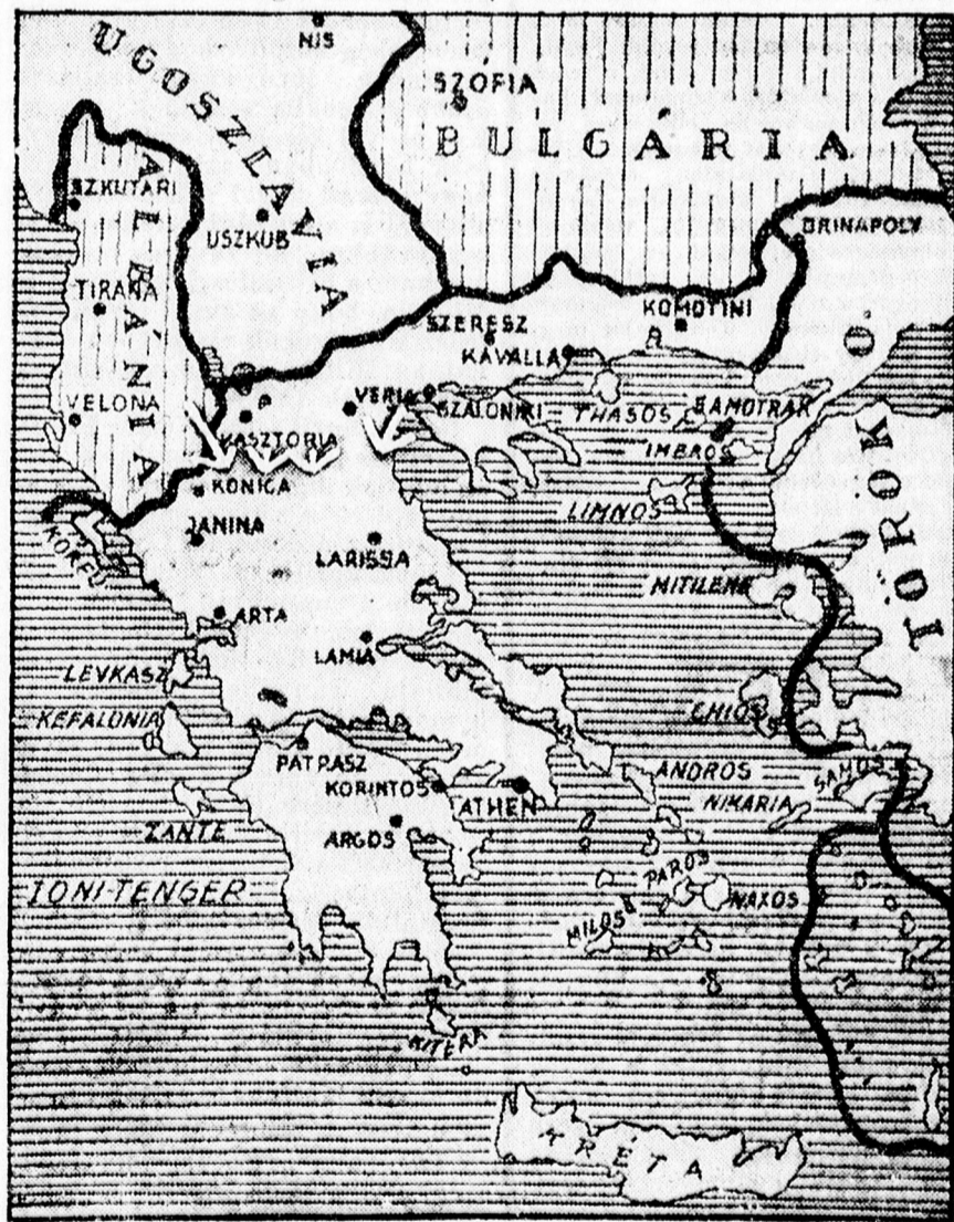
A német és olasz előnyomulás nyilakkal jelezve.

Ujabb rendelet a váltókról. Hirdetmény a még be nem jelentett készletek utólagos bejelentésének engedélyezéséről.