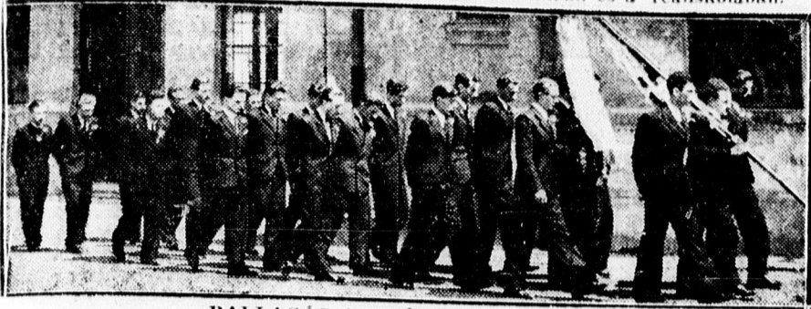
BALLAGÁS A REÁLISKOLÁBAN

Nyolcadikos diákok búcsúja a piarista gimnáziumban és a reáliskolában.