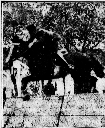
AZ AKADÁLY FELETT...