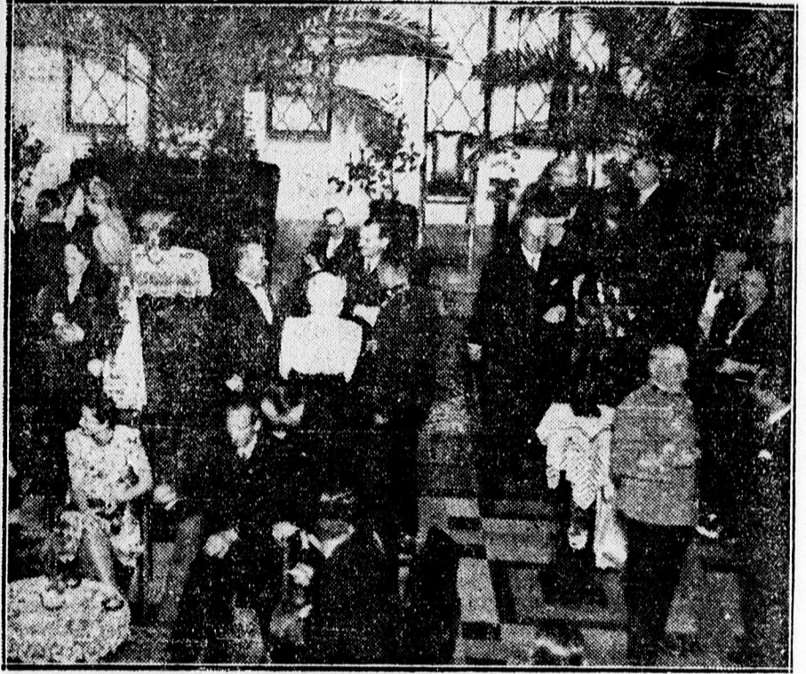
A német vendégek tiszteletére rendezett fogadóestről az egyetem díszudvarán.

— Fegyvergyakorlatról visszatérve, műtermem vezetését átvettem. Szipál udvari fényképész-mester.