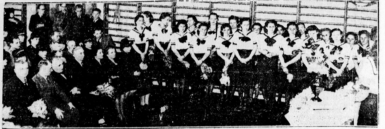
A REFORMÁTUS TANÍTÓ NŐKÉPZŐ VÉGZETT NÖVENDÉKEI NEK BÜCSÜÜNNEPELYÉRŐL.

FESTESSEN TISZTITTASSON Koncznál Péterfia u. 30. szám