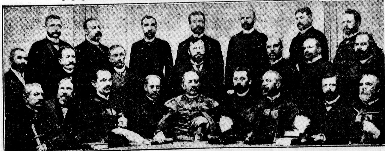
Az ötven évvel ezelőtt megalakult debreceni ítélőtábla első elnöke (elől a középen), két tanácselnöke és hírei.

Bukarest, május 17. Galánthay Nagy László, az újonnan kinevezett bukaresti magyar követ szombat déli 12 órakor a szokásos ünnepélyes keretek között rövid beszéd kíséretében nyújtotta át megbízólevelét a királynak. A király a beszédre rövid beszéddel válaszolt, majd elbeszélgetett az új követtel. Az új magyar követ ezután bemutatta az uralkodónak a kíséretében levő katonai attasét és a követség tagjait. (MTI.)