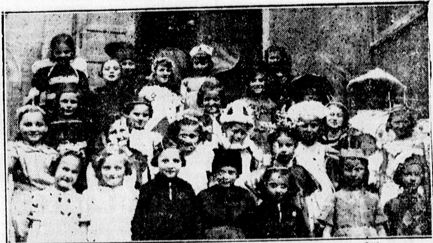
„A pörüljárt szunyog” című mesejáték szereplői.

Az előadás egyik legnagyobb sikere volt a Dóczy elemi iskola növendékei által táncolt első magyar körtánc.