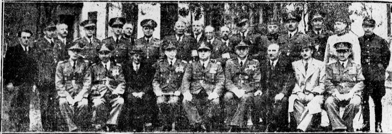
TÜRENDEZSÉTI KERÜLETI ÉRTEKEZLET RÉSZTVEVŐI DEBRECENBEN