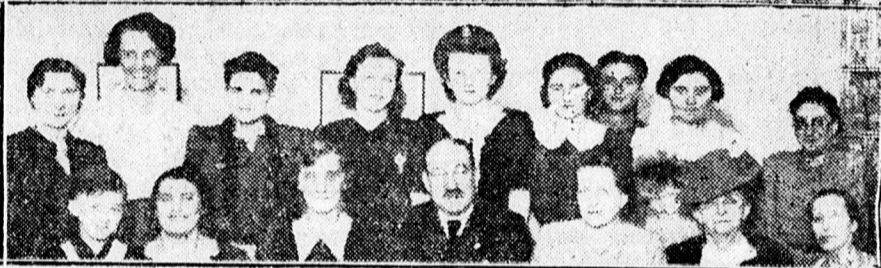
A DEBRECENI OLASZ KULTURINTÉZET ÜNNEPELYERŐL

x Fegyvergyakorlatról visszatérve, műterem vezetését átvettem. Szipál udvari fényképezőmester.