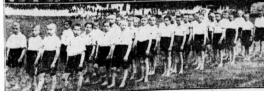
A ref. elemi iskolások tornabemutatójáról.