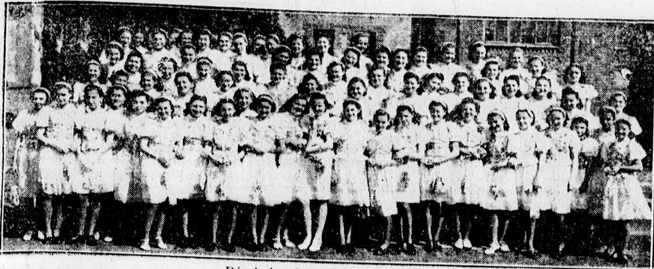
Dóczy gimnáziumi konfirmálók csoportja.