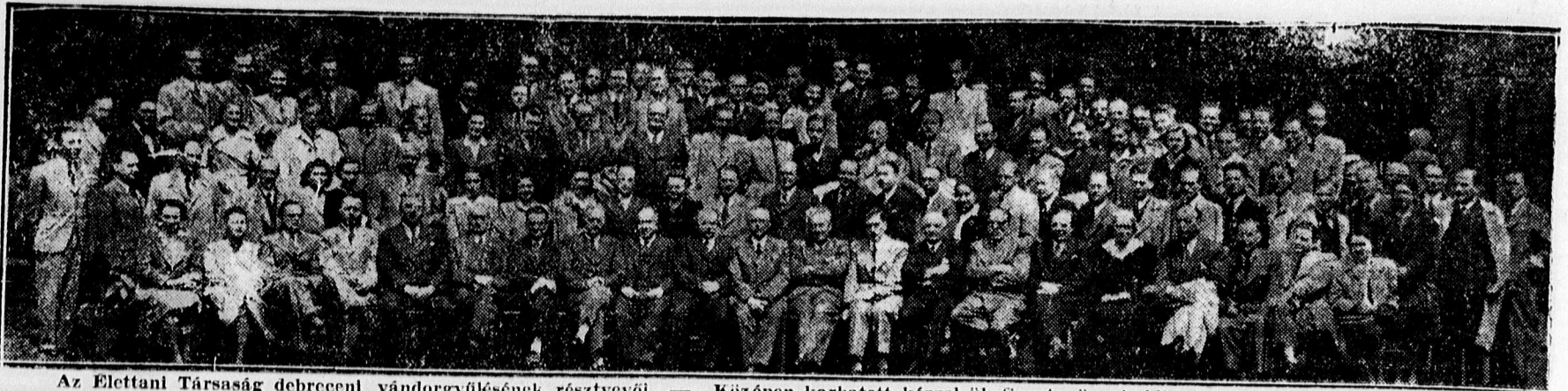
Az Elettani Társaság debreceni vándorgyűlésének résztvevői. — Középen karbatett kézzel ül Szentgyörgyi Albert Nobel-díjas professzor. —