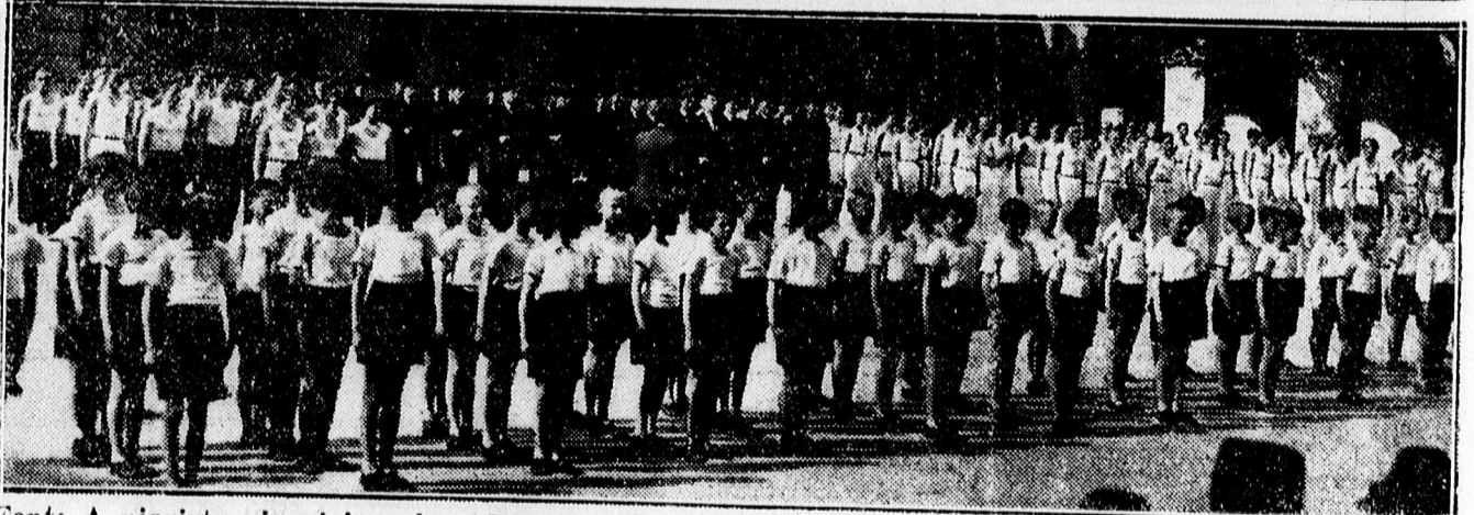
Fent: A piarista gimnázium és a DVSC sportrepülői.