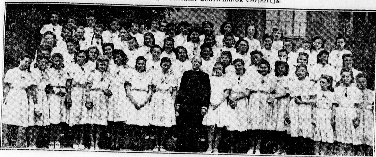
Dóczy polgári iskolai konfirmálók csoportja.