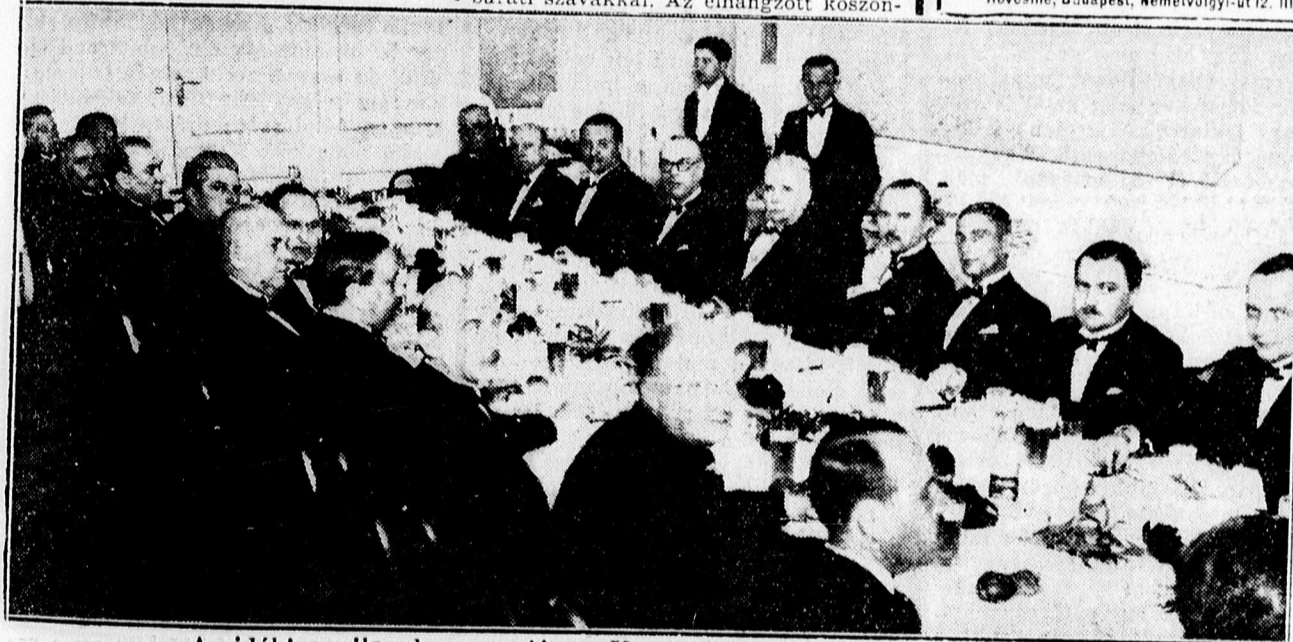
A vidéki napilapok vacsorája a Hungária szálló különtermében.

Perfekt angol német francia hölgy juniustól szeptemberig urisoknál különszoba, ellátásért és némi fizetésért tanítana vagy titkárnőnek menne, géprással. Hevesiné, Budapest, Némethölgyi-út 12. III. l.