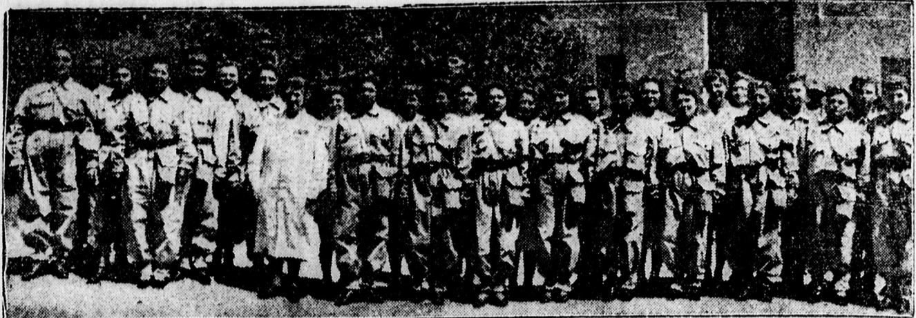
A leánygárda, amely nagy sikerrel szerepelt az Anna főhercegnő jelenlétében tartott légoltalmi bemutaton.

— Széles nyomtávu vasút épül Volócon, miután a magyar-orosz vasúti egyezmény értelmében a Szovjet-Orosorszag felől érkező vonatok Volóc határállomáson át magyar területre futnak be s az átrakodás magyar területen történik.