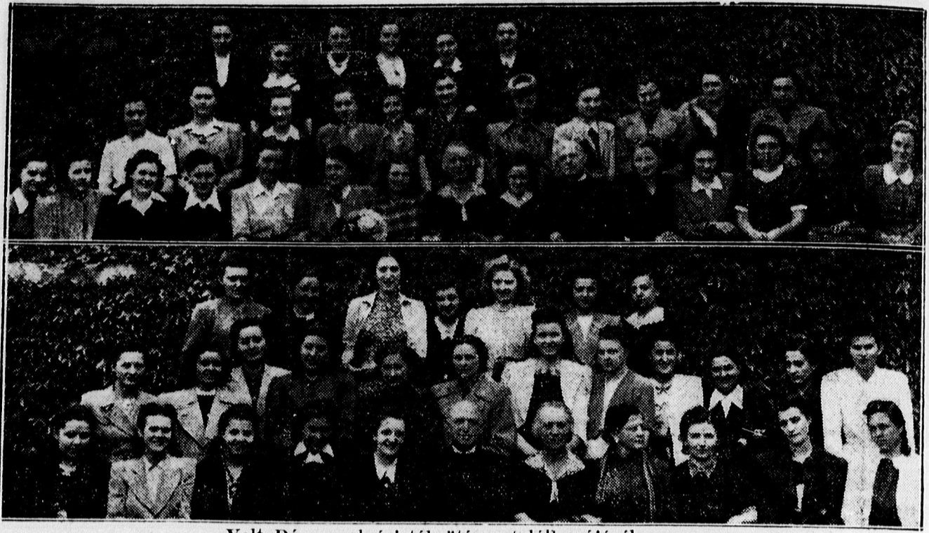
Volt Dóczy polgáristák öt éves találkozójáról.

— Mandlin és Mozsárné, a holttestdaraboló gyilkosok letartóztatásának ügye a vádtanács elé került felfolyamodás folytán, melyet előzetes letartóztatásuk ellen jelenettek be. A vádtanács jóváhagyta az előzetes letartóztatást. — Az ausztráliai nőknek megtiltották a külföldre utazást, hogy elegendő nő álljon az országban rendelkezésre a hadiipar és a betelepítés céljaira.