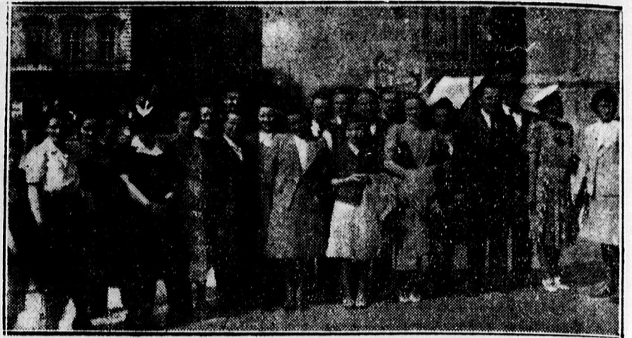
Ruszín tanítók és tanítónők Debrecenben.