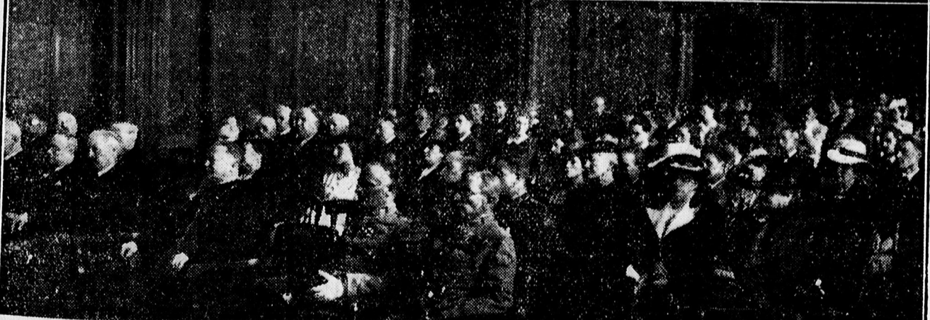
Az egyetem évzáró közgyűlésének közönsége.