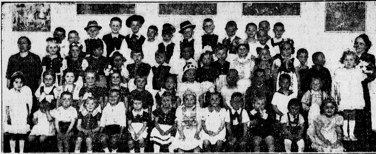
A TIMAR UCCAI OVODA ZÁRÓVIZSGÁJÁRÓL.