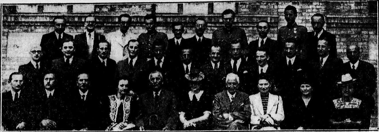
Tízéves érettségi találkozó a ref. gimnáziumban.

PÉTERFIA U. 19. TELEFON 38-39. Raktáron tartok modern új cse- répkályhákat és kandallókat. — Elvállalok átrakást, tisztítást jutányos árban.