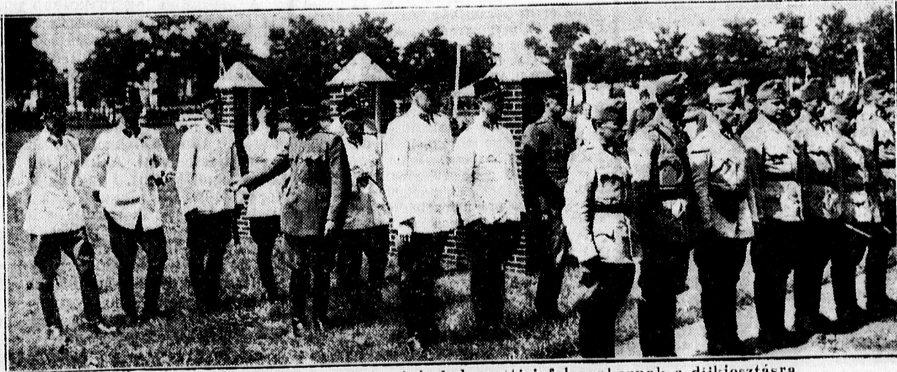
A helyőrségi lovasmérkőzés győztesei és helyezettei felsorakoznak a díjkiosztásra.