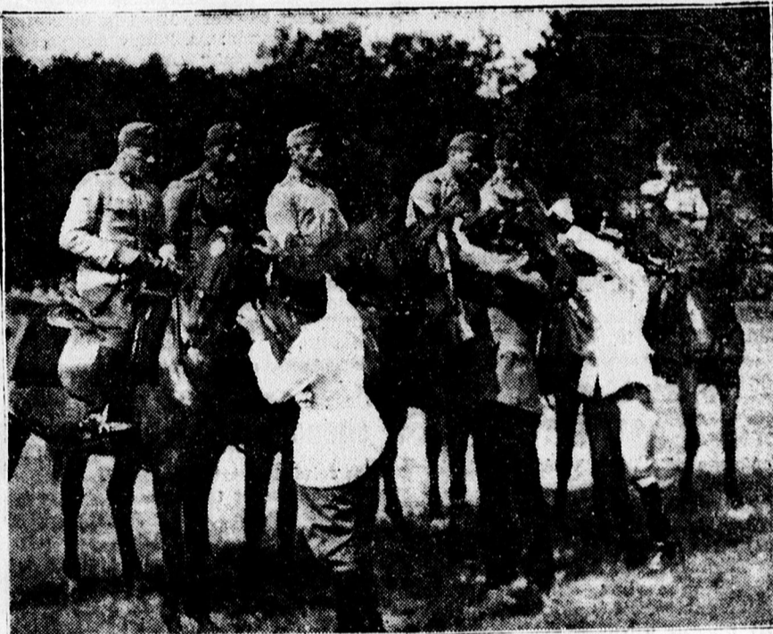
Díszes szalagot kapnak az altisztí díjugratás győztesének és helyezetteinek loval.