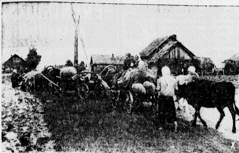
Visszatérnek a menekültek a felszabadított orosz falvakba.