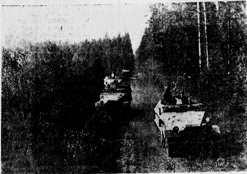
Német és szövetséges páncélos csapatok előnyomulása Ukrajnában nagy erdősegeken keresztül