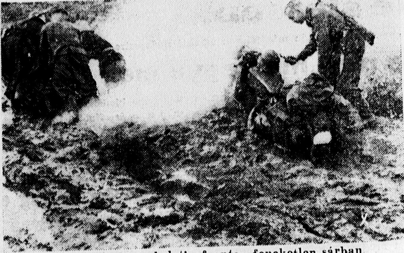
Előnyomulás a keleti fronton feneketlen sárban.

— Istentiszteletek a baptista imaházban. A Szappanos uccai imaházban vasárnap d. e. 9—12-ig — d. u. fél 3—fél 5-ig és fél 7—9-ig ifjúsági előadások, vendégládák közreműködésével, zene- és énekszámokkal. Szerdán este fél 8—fél 9-ig bibliaóra. Péntek este fél 8—fél 9-ig imaóra.