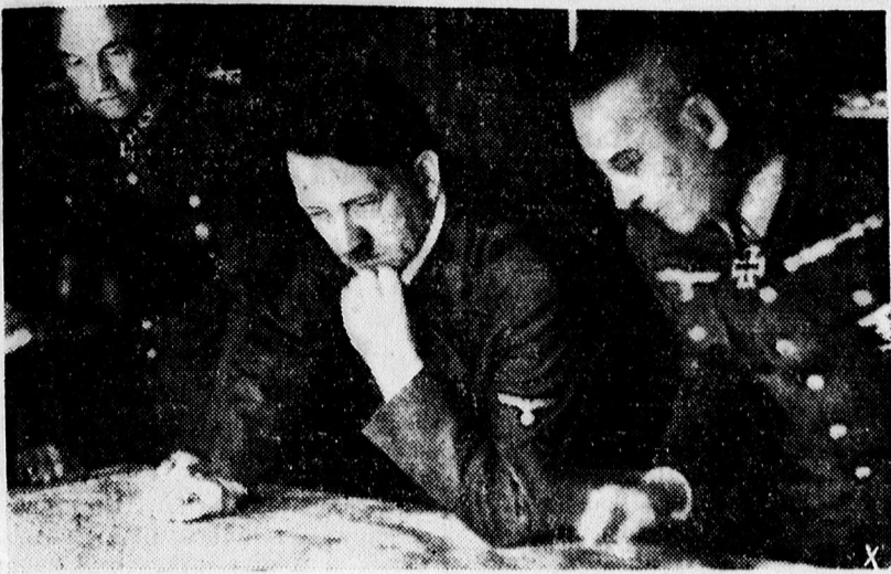
Hitler vezér a főhadiszálláson munkatársaival.