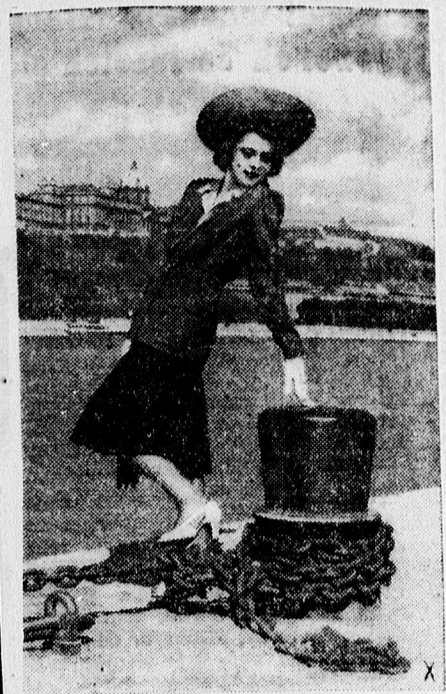
Új őszi divat

— Hirdelmény. Értesitem az érdeklődőket, hogy az 1939-40. és az 1940-41. évek telén a Kösülyszegben kitermelt és a várost illető kb. 18.650 kéve, valamint a Szikgáton kitermelt kb. 700 kéve nád eladására szeptember hó 11-én, csütörtökön délelőtti 9 órakor a Városháza gazdasági ügyosztály félelem. 22. sz. szobájában nyilvános árverést fog tartani. Közlelbbi feltételek ugyanott a hivatalos órák alatt megtekinthetők. Gazdasági Tanácsnok.