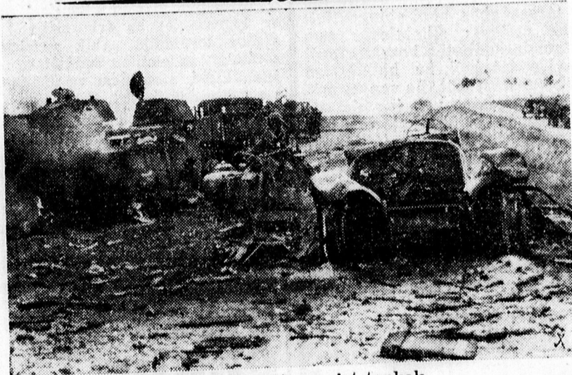
Szétlőtt és elfogott szovjet tankok.

Reggel 6 órakor még az iskolák zárva vannak, a váróteremben hideg van, vagy talán nem is mehetnek be. Így kénytelenek lennének a tanítási idő