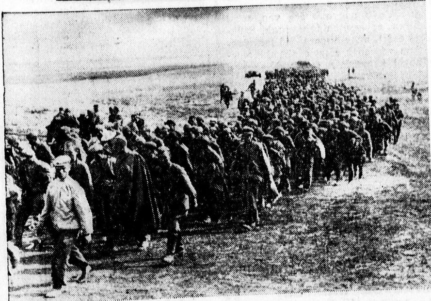
Magyar csapatok által ejtett bolsevista foglyokat gyűtő-táborba kísérik.

tollat, pehelyt legmagasabb napi áron vásárol.