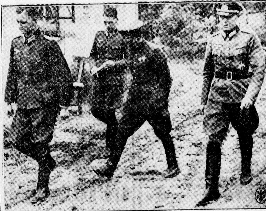
A 6. szovjet hadsereg főparancsnoka német fogságba került. A szovjet főparancsnokot (középen) német tisztek kísérik.

Newyork Tribune washingtoni értesülése szerint az Egyesült Al-