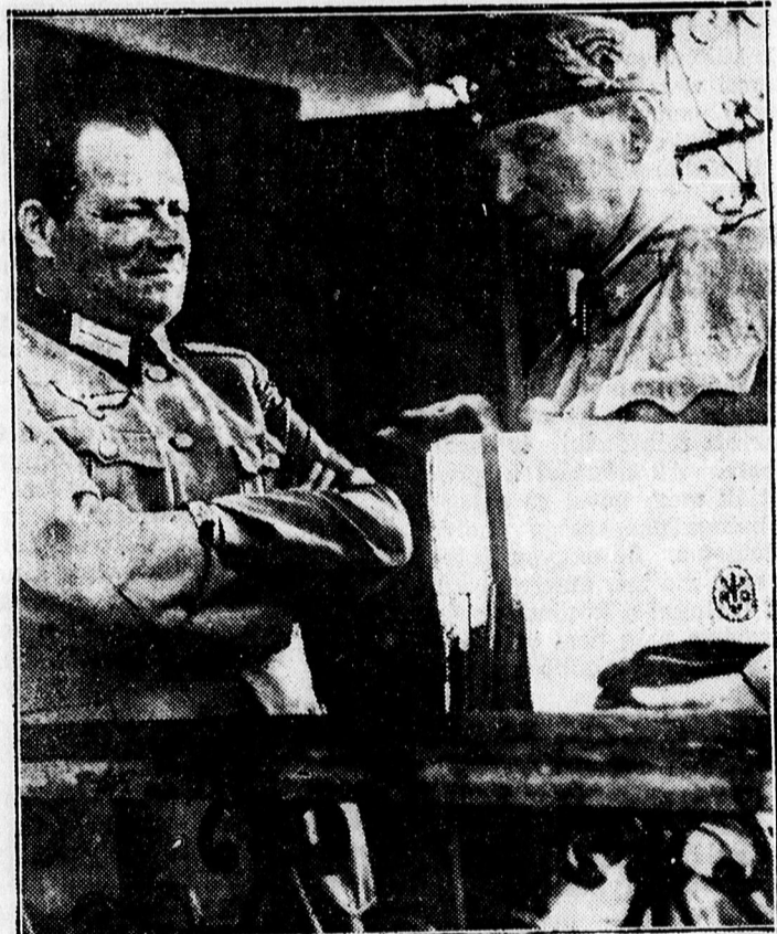
Magyar és német törzstiszt megbeszélést tart az ukrajnai fronton.

lás szomorú éveiben a községhezán rejtvegetett, majd a felszabadulás után újra felállított „Turul” szobormű előtt folyt le az ünnepély további része. Itt a szobormű előtt a katonai és polgári előkelőségek, továbbá a meghívott közönség színpompás gyűrűjében helyezték el a már megáldott és megszentelt három darab új zászlót. A gyönyörű, tűző napsugaras ősz-eleji délelőttön úgy nézett ki ez a ropant térség, mint egy mező virágok pompájában álló nagy rét. A székelyhídi asszonyokról példát vehetne az egész anyaországi magyar női társadalom, ők ugyanis szinte tüntetnek a magyar ruhákkal s mint a felszabadulás óta eddig minden ünnepélyes alka-