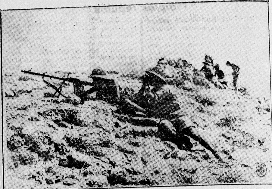
Harcok az északafrikai nehéz terepen.