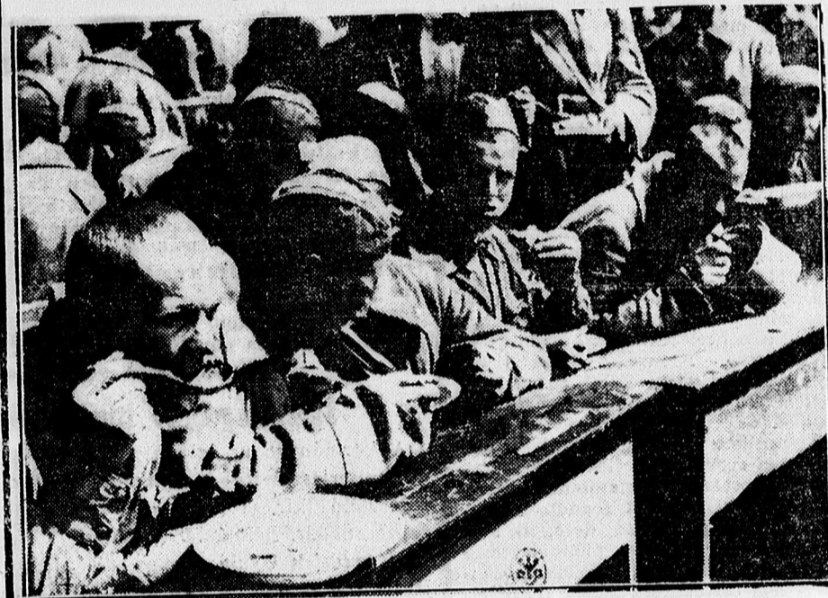
A szovjet hadifoglyok meleg ételt kapnak a foglyotáborban.

— Kairóban sztrájkolnak a közlekedési alkalmazottak. Szerdától a villamosok és autóbuszok egész személyzete leállt, fizetésük fel-emelését követelik, mivel a létfenntartási költségek óriási mértékben emelkedtek.