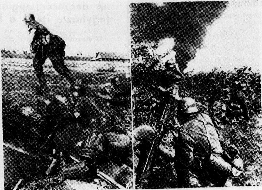
Harci jelenetek a keleti frontról.

— Templomot ténchelyiséggé ala- kították át a bolsevisták. A Svéd TI levelezője jelenti, hogy a Ladoga- távon levő Valano szigetét elfoglaló finnek megállapították, hogy az ottani templomot a bolsevisták ténchelyisé- séggé alakították át. A Svenska Dag- bladet közli, hogy Mannerheim tábor- nagy hétfőn meglátogatta az első von- alban a pétervári arcvonalszakaszt.