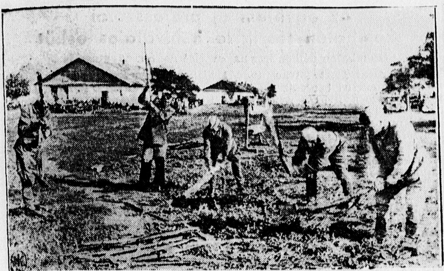
Elfogott szovjet katonák összetörtek fegyvereiket.