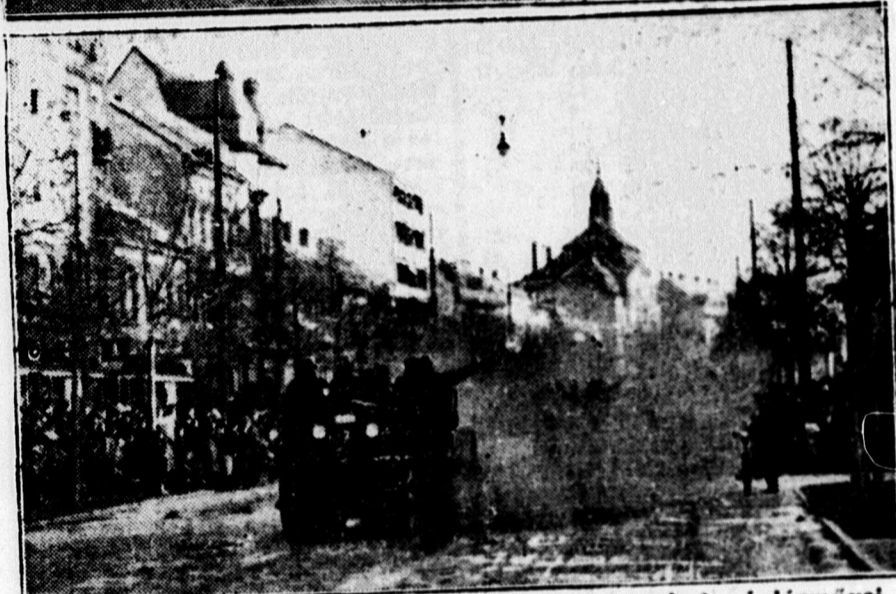
Ezrek sorfala között vonulnak el a légvédelmi tüzérek gépjárművel.