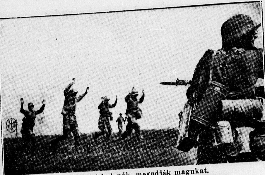
Szovjet katonák megadják magukat.

kövező s. 46 éves korában váratlanul elhunyt. — Temetése kedden délután 3 órakor lesz a Köztemető ravatalozó teremből ref. szertartással. — Lakása: György u. Pusztai temetkezési intézet.