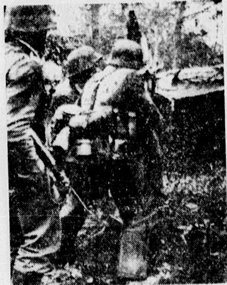
Szovjet ellenállási fészek megrohanása.

repa, borsó, vöröshere és kömény, amit láttam.