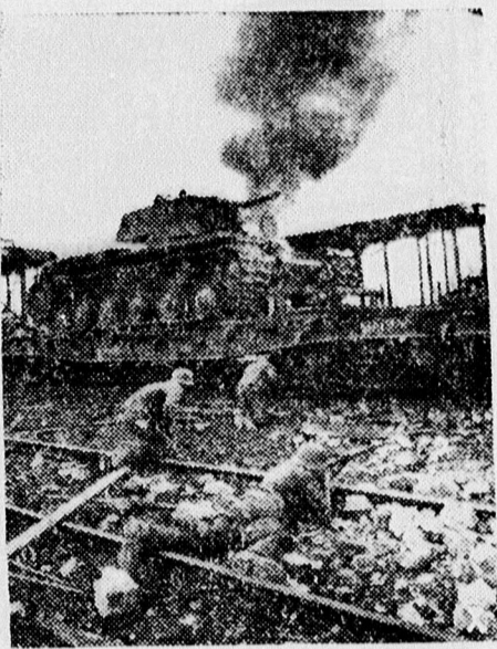
A keleti frontról: roham egy megsemmisített szerelvény ellen.