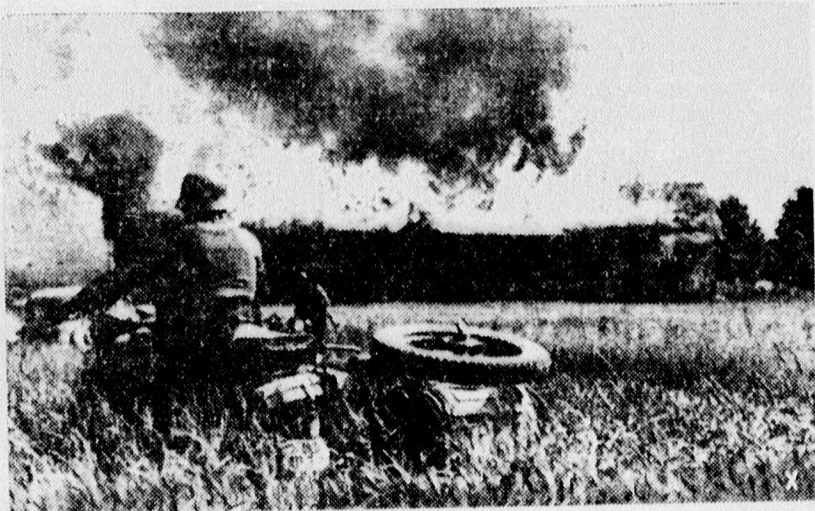
Felgyújtott majoron át robot a jelentést vivő motorkerékpáros.