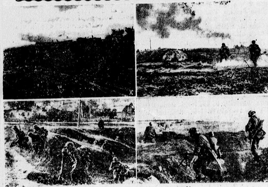
A leningrádkörüli harcokból.

Háry János. Az Apolló mozgó új filmje kitűnően szórakoztató, derűs meséjével, gyönyörű muzsikájával, a nagyokat mondó magyar mesealak szerepében Páger kitűnő alakításával nagy siker. A kísérő műsor kitűnő.