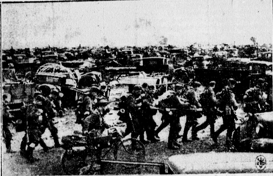
Beláthatatlan hadizsákmány között vonulnak előre Moszkva felé a német gyalogosok.

A polgári oklevél igen becses okirat volt, amely arra is feljogosította tulajdonosát, hogy a városi kis- és nagytanácsba taggá válasszák. Összesen 66 tag került így be a városházára, akik közül 12 esküdtet és a főbíró is kismélték. Természetesen e tisztségekre is csak a rendkívüli képességgel és jártassággal, erkölcsi alappal bíró egyének választottak meg. A régi jegyzőkönyvek szerint nem volt megkülönböztetés tekintetben, hogy az illetők Debrecenben, vagy idegenben születtek. Mindig az egyént bírálták el. Ha a mértéket megütötte jellem, tudás és teherviselő képesség dolgában, akkor minden út megnyílt számára, hogy a református republikaiban a legbecsültebb és tiszteltettség vezető szerepet elnyerhesse. A szellem, amely egykor a debreceni közéletet betöltötte, az idegenből jött embert is átalakította. — Tehetségtelen akarnokok soha sem jutottak szerephez, mert a józan debreceni gondolkodás feltörekvő útjokban idejekorán megállította őket. (b. s.)