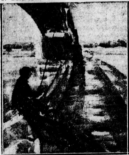
Sényei Oláh István: „Horgászó” című képét megvásárolta a Fővárosi Múzeum