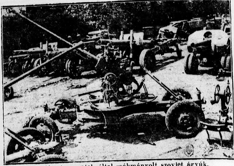
Német csapatok által zsákmányolt szovjet ágyú.

— A német pénzügyminiszter Bulgáriába érkezett, hogy viszonzza a bolgár pénzügyminiszter berlini látogatását.