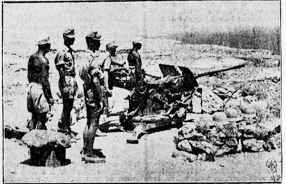
Az afrikai harcokból. Előretolt német állás.