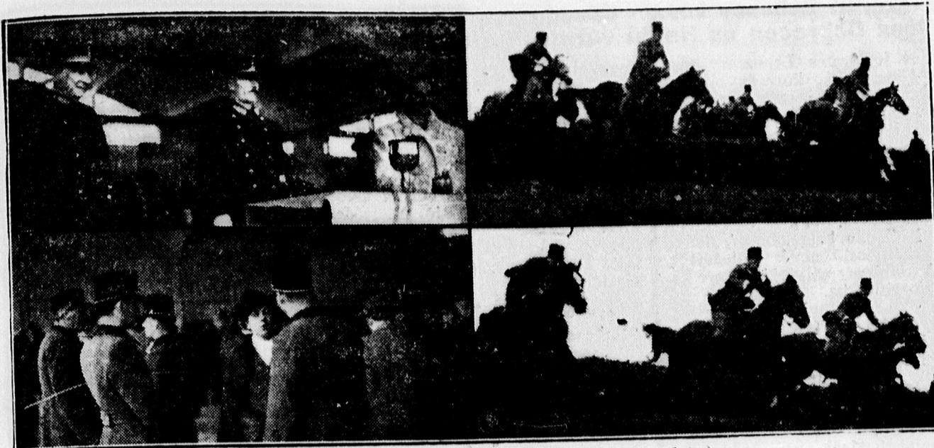
Képek a Hubertus-versenyekről.