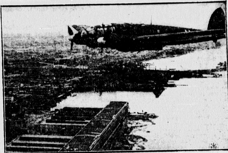
Német repülőgép egy szovjet város fölött.

— Kémszabotázi kísérlet az elsőf. tités alatt. Stockholmban tegnap újból négy embert tartóztattak le, mert kiderült, hogy szeptemberben egy elsőf. tités gyakorlat alatt ki akarták szabadítani börtönéből egy kémkedés miatt letartóztatott angol állampolgárt.