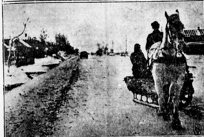
Leningrád körül már havazik. Erős havazásban folynak a hadműveletek. A front mögött szánokon közlekednek.