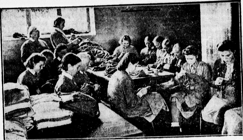
A finn Lotta tagjai javítják a frontkatonák ruháit.

Kényszerrendszabályokat alkalmaznak Iránban az anglok. Lefoglaltak több ezer gépkocsit és az úthálózat kijavítása céljából kényszermunkára fogtak be sok perzsa munkást.