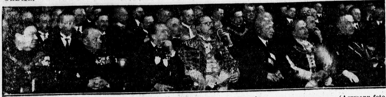
A VÁRMEGYEI KÖZGYÜLÉS KÖZÖNSÉGE.