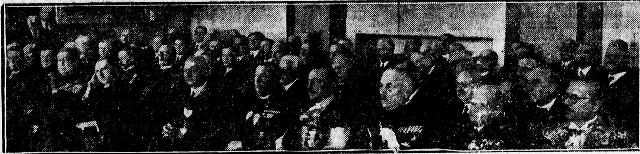
A VÁROSI INSTALLÁCIÓ KÖZÖNSÉGE.

Eros munkakészség, a különböző foglalkozási ágak jogos érdekének megértése, de legfőképp a hadbanálló országban annyira fontos belső front nyugalmának, szilárdaságának, a társadalmi béke megővésének eltökélt szándéka jellemzik az új főispánt és reményt nyújtanak arra, hogy az emelkedett szellemű kijelentések a mindennapi élet gyakorlatában folytatást és megvalósulást találnak.