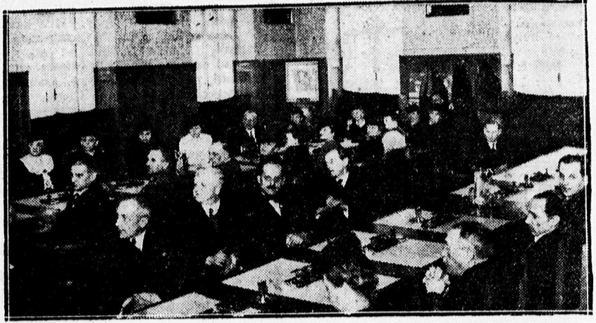
A Vöröskereszt helyi választmányi üléséről, melyen a kitüntetéseket átadták.