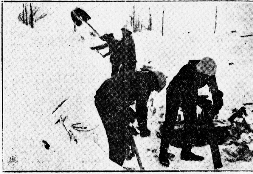
A keleti frontról: A lövészárkot betemette a frissen hullott hó. A lövészárkok lakói szabaddá teszik az árkot.