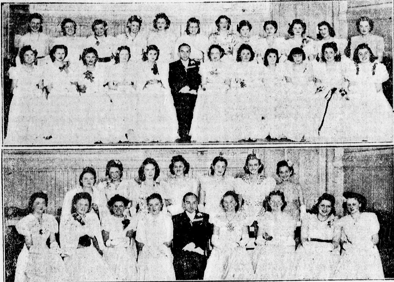
Első bálzó úrleányok a Csaba-táncestélyen