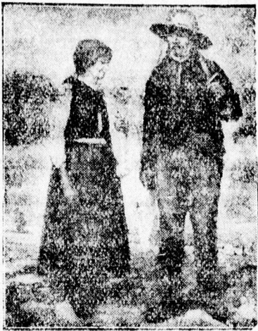
Littecki Endre alkotása „Házatérés“

Littecki Endre erdélyi festő- művész, aki 1940-ben emléke- zetes nagy sikert aratott Deb- recenben rendezett kiállításá- val, 74 megkapóan szép mű- vészi alkotással jelent meg a ma d. e. 10-kor a Déri Múzeum kiállítási termében megnyíló tárlatán.