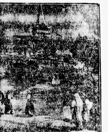
Templombamenés Kőrösfőn. a Litteczki képkállításból. Déri Múzeum Nyitva 10—1, d. u. 4—7.

Napról-napra növekvő siker- van a kiváló erdélyi festőművész Litteczki Endre kiállításának a Déri Múzeum kiállítási termé- álládoan nagy csoportok lator- gatják, gyönyörködve a kiváló festőművész kivételes tehetség alkotásaiban. A hatalmas erköl- csi siker mellett már számos képet vásároltak.