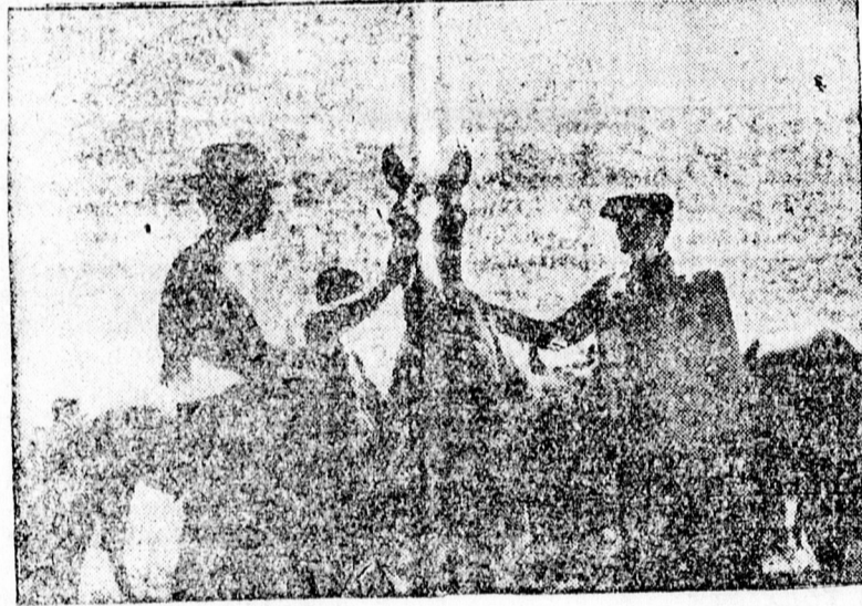
Magyar parasztok szemlélik az Iljics-kolhoz gulyáját

met szereznek. Baromfi-élejük is van, 560 tojó tyúkkal. Amikor a vész után érdeklődünk, azt mondták: ez nálunk ismeretlen, mert évenként kétszer beoltják az állományt. Van ebben a kolhozban 260 darab szarvasmarha, ebből 150 fejős. Van 50 méhcsalád, 180